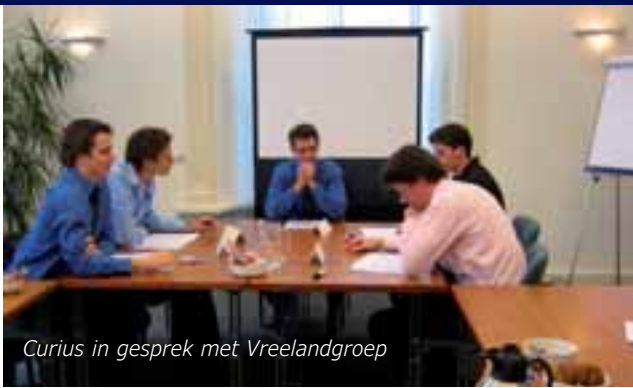
Curius in gesprek met Vreelandgroep

Het nieuwe jaar is weer in volle gang, de tentamens zitten er weer op en er wordt weer volop koffie gedronken op het Curiusshok. Wij waren wel weer toe aan wat leven op het hok. Na een periode van rust in de kerstvakantie zijn we in de witte weken aan de slag gegaan met onze nieuwe ideeën. Zo is de nieuwe website bijna klaar, zijn voor bijna alle eerstejaars domeinvakken excursies georganiseerd, zijn we aan het onderhandelen over goedkopere boeken en zijn we bezig met het opzetten van een enquête onder de leden.